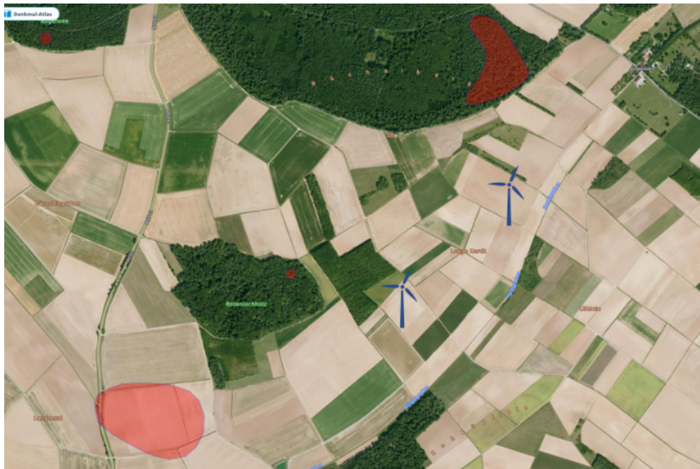
Unten links in rot eine vermutete Siedlung aus der Jungsteinzeit, mittig und oben werden Gräber vermutet. (Montage: Denkmalatlas mit Windrädern)

Bald werden wir an den zukünftigen Standorten den Boden sondieren, damit wir die Voraussetzungen für den Fundamentbau kennen. Wenn es notwendig ist, werden wir an manchen Standorten den Boden mit „Rüttelstopfverdichtungen“ stabilisieren. Dabei werden Säulen aus Kies oder Schotter in den Boden eingebaut, die das bestehende Bodenmaterial zur Seite drängen und dadurch verdichten. Damit werden die Böden für den kommenden Fundamentbau ertüchtigt.