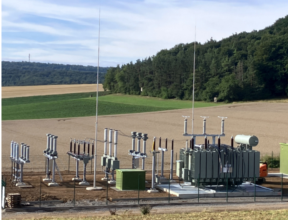
Unser Umspannwerk in Remlingen während des Baus

Denn: Wenn der Wind weht ist es meist bewölkt, scheint die Sonne, ist eher wenig Wind.